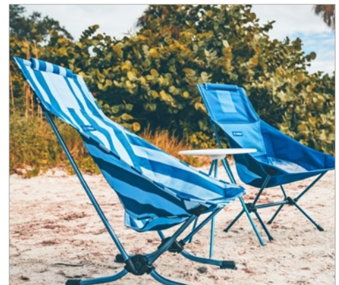
Helinox Beach Chair in „Blue Stripe“ und Chair Two in „Blue Block“.

www.k-g-k.com/helinox_große_stuehle_farben_s20