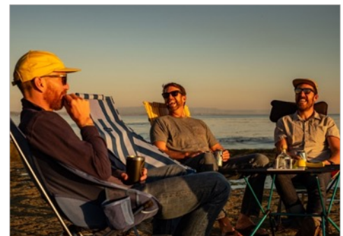
Savanna Chair in „Blue Block“ und Sunset Chair in „Blue Stripe“ und „Red Stripe“.