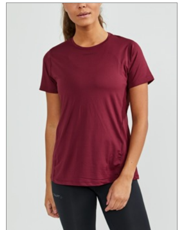
ADV Essence Shortsleeve Slim Tee W