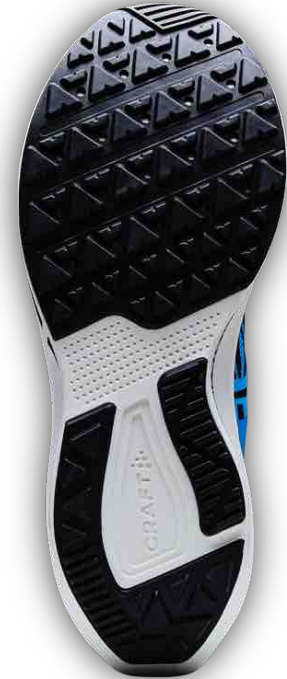
Langlebig: die CRAFT Ultra-Trac Outsole