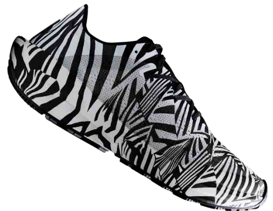
Schnell: Die Ultra Carbon Plate von CRAFT sorgt für einen besseren passiven Energie-Return.